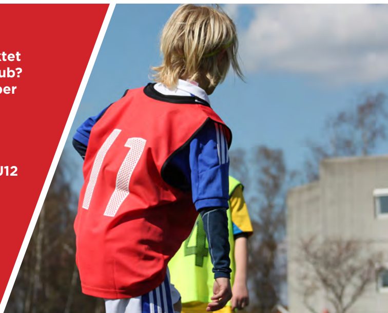
UDVIKLINGSORIENTERED E TRÆNINGSMILJØER